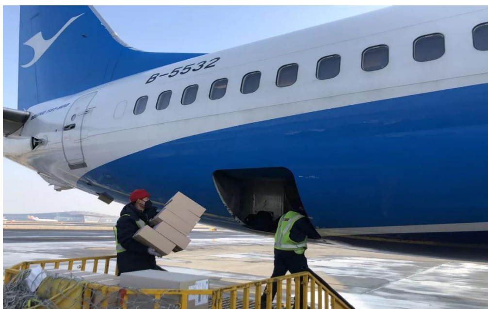
防疫物资发往福建

部分防疫物资已于2月7日运抵中国，其余在10日前陆续抵达，经北京转运福州，交由福建省相关部门接收。