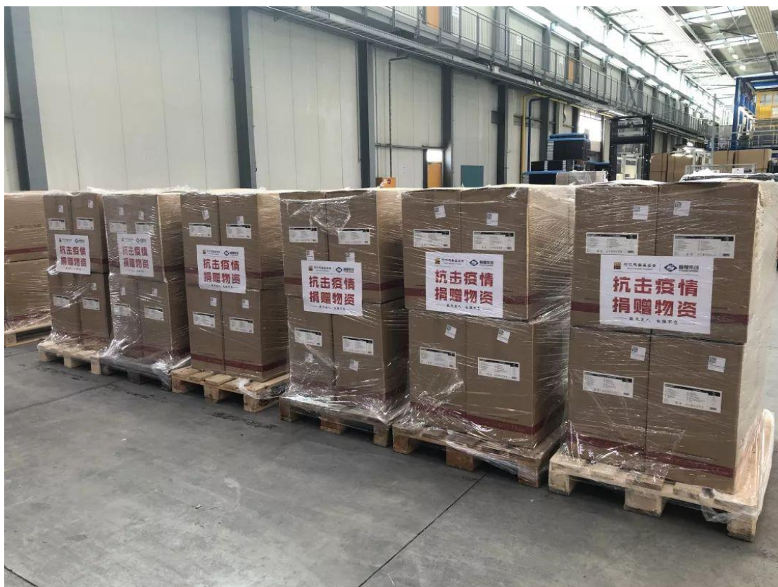
德国、法国物资集结

部分防疫物资已于2月7日运抵中国，其余在10日前陆续抵达，经北京转运福州，交由福建省相关部门接收。